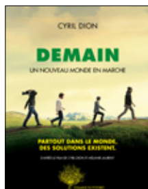
DEMAIN Un nouveau monde en marche Cyril Dion

Cet ouvrage est le récit de la genèse du film mais aussi des différentes étapes de ce voyage extraordinaire qu'a représenté le tournage. Il permet au lecteur d'approfondir les thématiques abordées dans le film et de découvrir des initiatives qui n'ont pas pu y figurer. En six grands chapitres — Nous nourrir pour ne pas disparaître , Réussir la transition énergétique , Une économie pour demain , Réinventer la démocratie , Une nouvelle histoire de l'éducation , Commencer à s'y mettre — Cyril Dion raconte ces rencontres hors du commun avec des femmes et des hommes qui changent le monde. Tantôt sur le mode du récit, tantôt sur celui du dialogue, en texte et en image, ce livre nous entraîne sur la voie du changement et de la transition, de l'espoir et de l'initiative, sur celle d'« un nouveau monde en marche ».